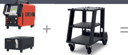
Refroidisseur par circulation d'eau WUK 5 : refroidisseur très puissant pour torche TIG refroidie par eau

Prête à rouler, avec Mobil Car et le refroidisseur par circulation d'eau. La série V mobil permet de travailler à une hauteur idéale, la bouteille de gaz est maintenue en sécurité dans son logement et la torche est refroidie par eau pour une performance optimale. Ainsi, la série V reste « mobile » et offre la fonctionnalité d'une grande installation compacte.