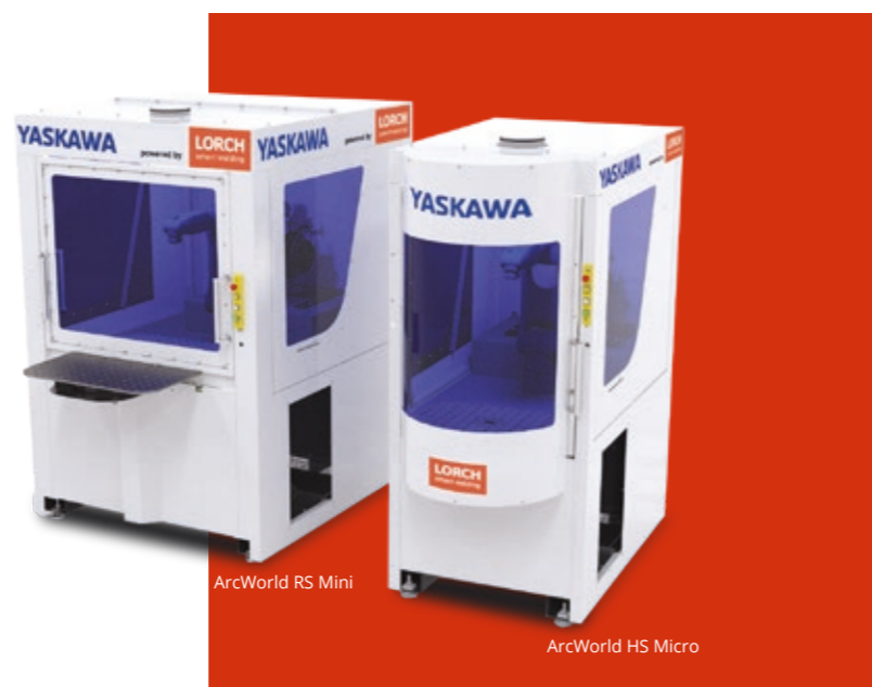
ArcWorld RS Mini

Une efficacité maximale est garantie par la porte pivotante intégrée à la cellule ArcWorld RS Mini de Lorch et Yaskawa. Pendant que le robot Yaskawa soude en toute sécurité et à grande vitesse à l'intérieur, la prochaine pièce à souder peut être préparée par l'opérateur à l'extérieur. Les pièces à souder s'échangent en toute simplicité et en toute sécurité en tournant la table de soudage. Cela réduit les temps d'arrêt et augmente le rendement.